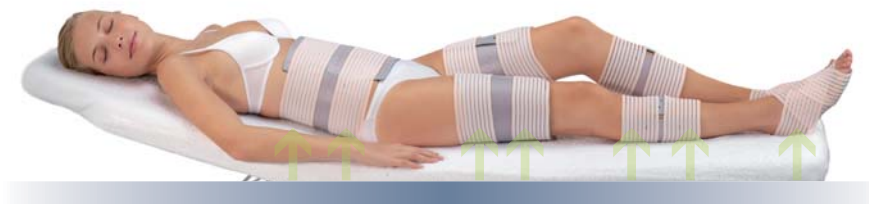
TRATAMIENTO INTEGRAL ABDOMEN, MUSLOS, GEMELOS Y PIES

RÖS'S fue pionero en el desarrollo de la termo-estimulación. Gracias a la continua investigación, su equipo de ingenieros ha diseñado las bandas de aplicación de última generación más sofisticadas para ofrecer al cliente óptimos resultados y máxima seguridad.