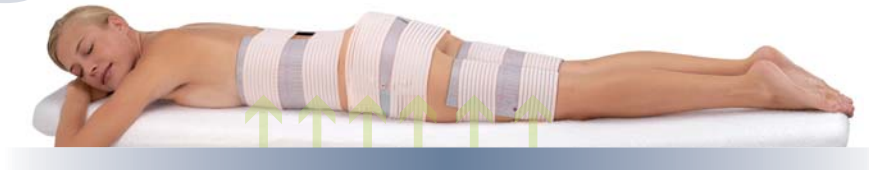
ACCIÓN GLOBAL PARA UN RESULTADO PROFESIONAL Y EQUILIBRADO